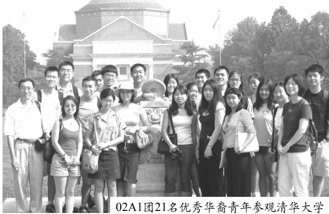
02A1團21名優秀華裔青年參觀清華大學